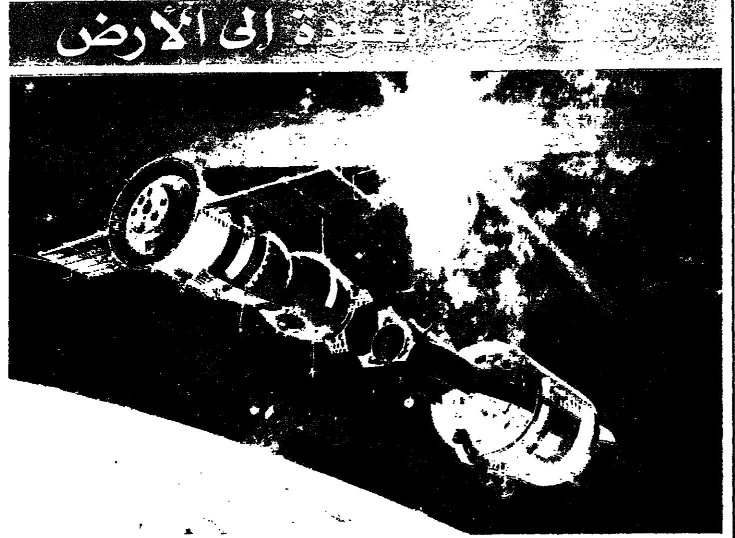
العربان «سويوز» و «ابولو» الانفصال بعد الانحياز

من اللاحرب والاسلم السى الحرب والاسلم قد يمر وقت طويل قبل معرفة المعلومات التي كانت امام الرئيس السادات حين قرر عدم التمديد لقوات الطوارئ. وان كان البعض يتوقع ان يكشف الرئيس المصري بعض هذه المعلومات في الخطاب الذي سيلقيه في ذكرى ثورة ٢٣ تموز.